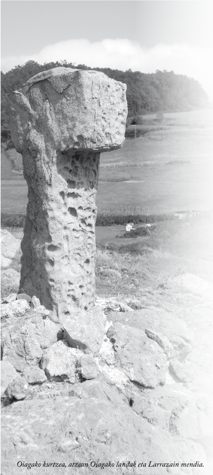
Oiagako kurtzea, atzean Oiagako landak eta Larrazain mendia.

Bakioko Gibelortzagako San Pelaioko auzoan iru landubako arrizko kurtze zaar egozan, orreetarik bi baino ez dira lotuten gaur egun. Ondinokarren zutunik dirauen kurtzeok oneexek dira: Oiagako kurtzea (oixako kurtzie) eta Atxulo kurtzea (atxuloko kurtzie) izenekoak. Biok itsasaldeko atxen ganean dagoz, Atxuloko atxen alde banatan, itsasoari begira, itsaso-jagola antzean egon be.