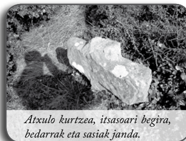
Atxulo kurtzea, itsasoari begira, badarrak eta sasiak janda.