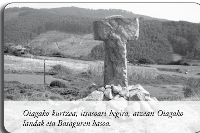
Oiagako kurtzea, itsasoari begira, atzean Oiagako landak eta Basaguren basoa.

Zemento-aroan bizi da Bakio gaur egun, bertan sartu-sartuta. Agiriko danez, olango txikikeriak, senti-